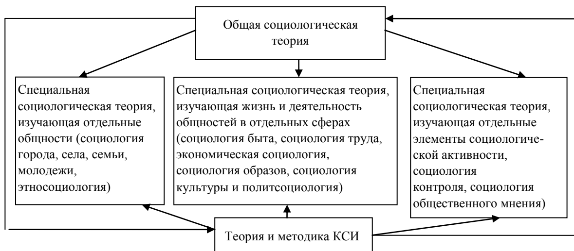
Рис. 1. Структура социологии

Существуют и другие основания структурирования социологии. Так, деление социологии на фундаментальную и прикладную связано с различием в целях и задачах. Фундаментальная социология решает теоретические задачи, прикладная – практические. Обычно в социологических исследованиях соединены обе группы задач. Особенно это проявляется на уровне специальных социологических теорий, которых свыше тридцати.